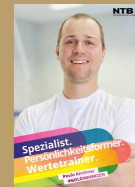
Pavlo Kirchner / TT