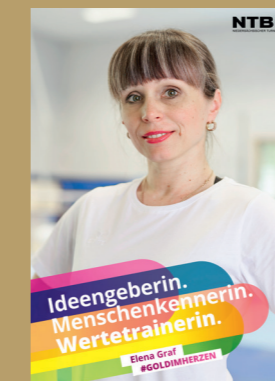
Elena Graf / TT